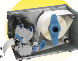
Rebobineur interne avec peeler

Parmi les fonctions standard de l'imprimante, on compte un mandrin pour rouleau de 10 pouces, une fonction d'étalonnage automatique pour un réglage rapide du support en cas de remplacement et un microprogramme flash téléchargeable pour faciliter la mise à niveau. Un rebobineur interne installé en usine avec peeler doté d'un capteur d'attente est disponible en option.