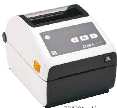
ZD420d - HC

Dans le secteur critique de la santé, fiabilité et précision sont de rigueur. Les imprimantes ZD420-HC de Zebra présentent des caractéristiques et des fonctionnalités qui facilitent comme jamais le déploiement, la gestion et l'utilisation, offrent une grande flexibilité des applications et réduisent le coût total de possession. Conçue pour l'industrie de la santé, cette imprimante résiste aux désinfections répétitives et est équipée d'un bloc d'alimentation conforme aux normes médicales. Déclinées en modèles thermique direct et transfert thermique, les imprimantes ZD420-HC combinent le système d'ouverture « bivalve » Zebra à une interface intuitive. Grâce à sa résolution de 300 dpi (en option), les étiquettes restent nettes et lisibles, aussi petites soient-elles. Les imprimantes ZD420-HC exploitent Link-OS® et sont prises en charge par Print DNA, puissante suite d'applications, d'utilitaires et d'outils de développement qui améliore l'expérience d'impression, grâce à une meilleure performance, une gestion à distance simplifiée et une intégration plus aisée. La ZD420-HC : l'imprimante qui conjugue simplicité d'utilisation, souplesse et facilité de gestion.