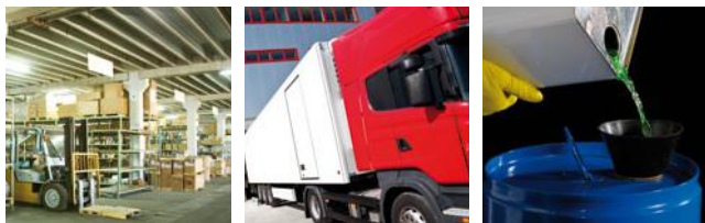
* La B-EX4T2 a été comparée aux produits concurrents en mode veille.

Les B-EX4T2 sont disponibles en 203/300 ou 600 points au pouce, permettant des impressions spécialisées en haute résolution avec une qualité d'impression supérieure.